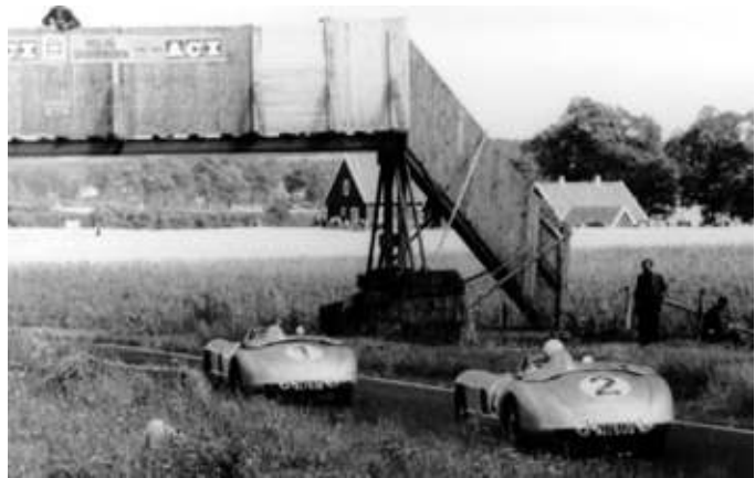
Postal repetida vuelta tras vuelta con los dos Mercedes dominando.

Mientras tanto, en juego de equipo, Fangio está delante de Moss y ambos cruzan la línea de sentencia separados por sólo 3/10.